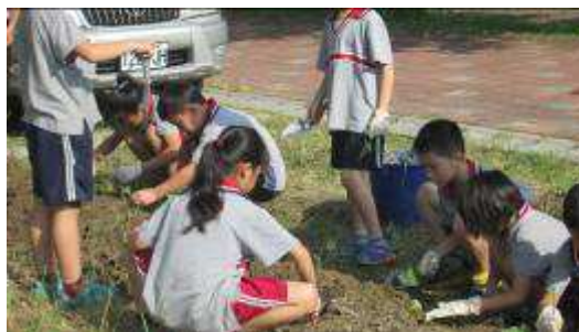
學生認養空間種植蔬菜