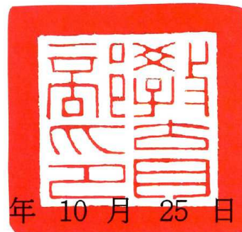
Minister of Education Republic of China (Taiwan)