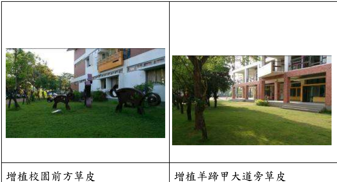
增植校園前方草皮