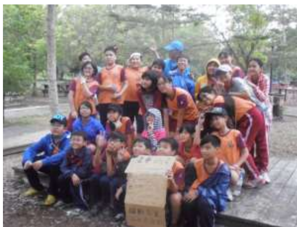
在大自然下團體活動