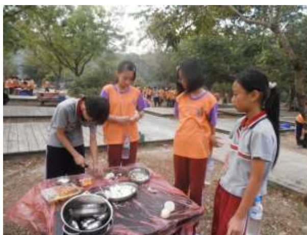
體驗戶外野炊，最後整理環境，將乾淨還給大自然。