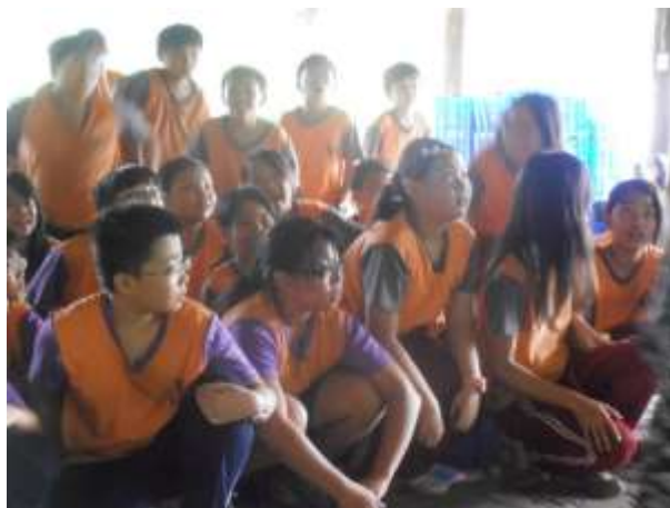
聆聽曾文水庫的歷史與功能。