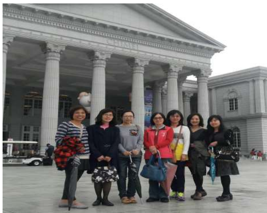
奇美博物館前合影