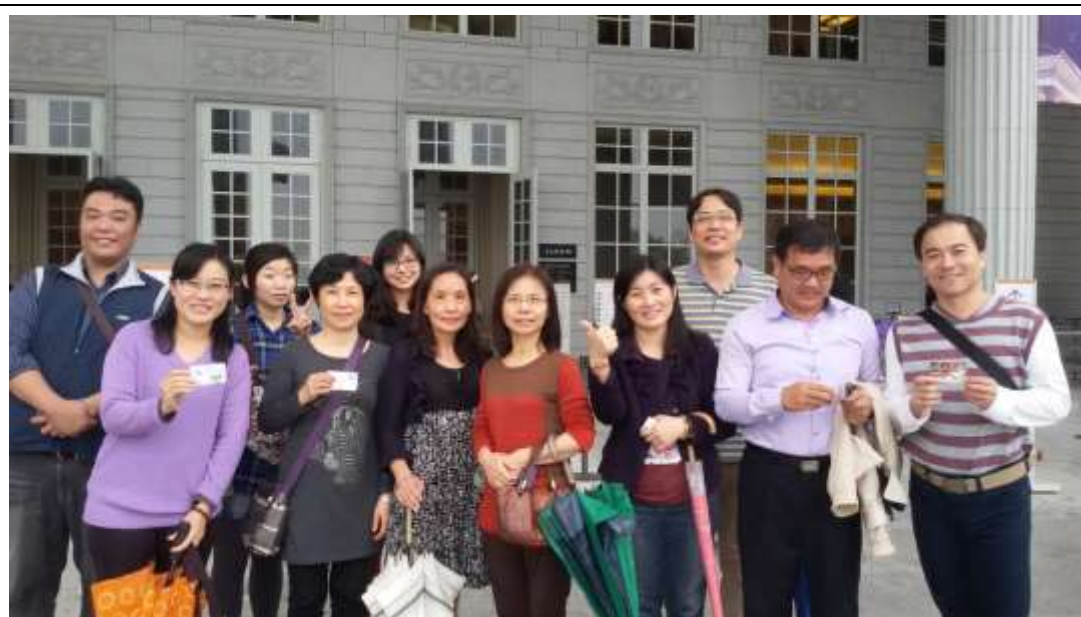
奇美博物館前合影